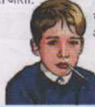
जावीर सर आसंगी तूर्क

उत्तर - दुषित अन्न - पाणी व वातावरणातील विषाणू - जिवाणू यांच्या परिणामांमुळे होणाऱ्या इन्फेक्शनला शरिर विरोध करत असते. शरिरात होणाऱ्या या प्रतिकारामुळे माणसाला ताप येतो. जसा प्रतिकार वाढतो व शारिरीक शक्ती कमी पडत जाते व ताप वाढत जातो.